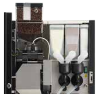
+ OptiBean 4, 2 Mixer und 3 Zutatenbehälter