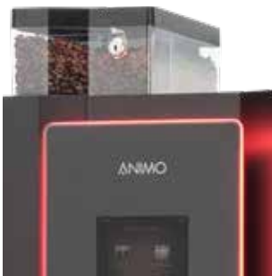
+ Frische Kaffeebohnen

Zusätzlich zum OptiBean ist der OptiBean XL mit einem extra großen Espresso-System für größere und vollere Tassen ausgestattet.