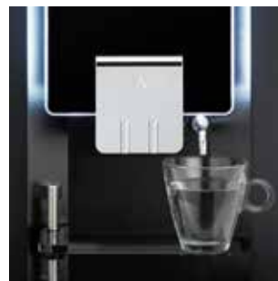
+ Separate Heißwasserzapfstelle